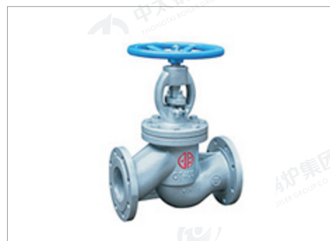
郑州宇明球墨铸铁 截止阀