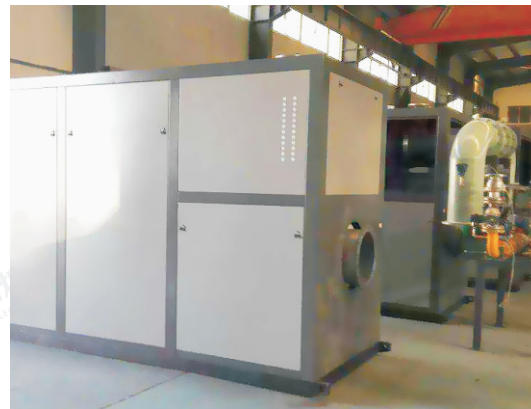
2017.03-8吨 ZLJ480 陕西西安唐城医院