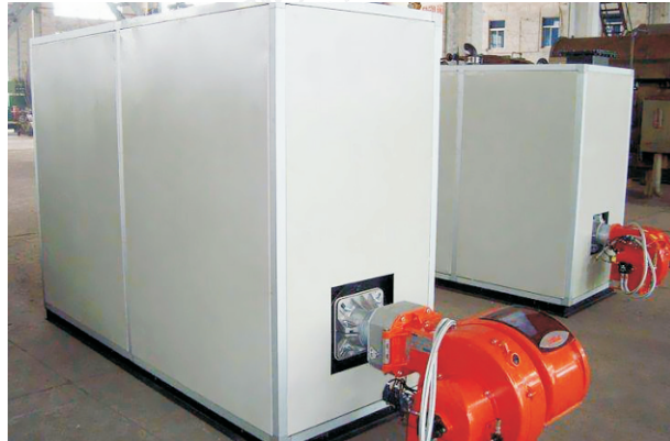
2014.02-20吨 ZLJ1200 新疆乌鲁木齐新疆科利尔能源有限公司