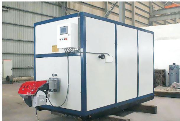
2016.08 5吨 ZLJ300 保定安新县安新小学