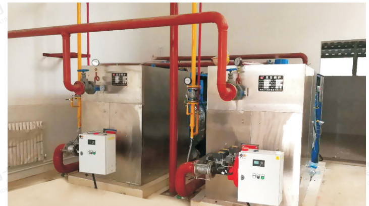
2016.12-2吨 ZZJ120 开封市妇产医院