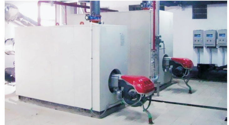
2015.12-0.5吨 ZZJ30 山东谛爱生物技术股份有限公司