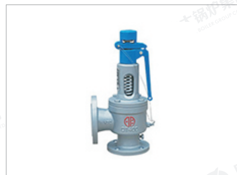
郑州明宇球墨铸铁 弹簧全启式安全阀