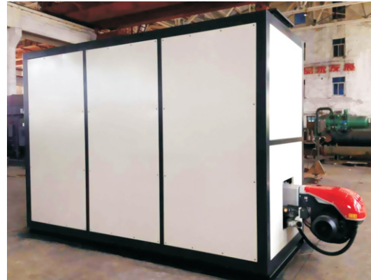
2017.09-12吨 ZLJ720 郑州枫岚科技有限公司